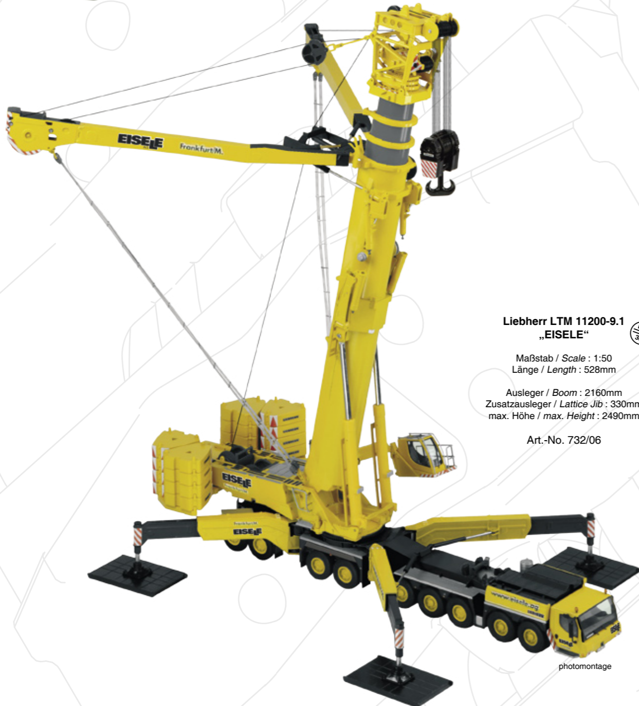
Liebherr LTM 11200-9.1 „EISELE“