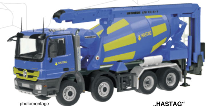
„HASTAG“ Art.-No. 797/03

Maßstab / Scale : 1:50 Länge / Length : 180mm