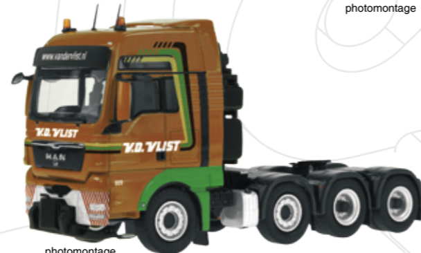
MAN TGX 8x4 Schwerlast-Sattelzugmaschine / Heavy Weight Truck „VAN DER VLIST“

Maßstab / Scale : 1:50 Länge / Length : 200mm Art.-No. 784