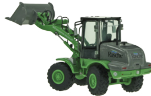
Liebherr L 510 Stereo „RASCHE“

Maßstab / Scale : 1:50 Länge / Length : 120mm Art.-No. 743/01