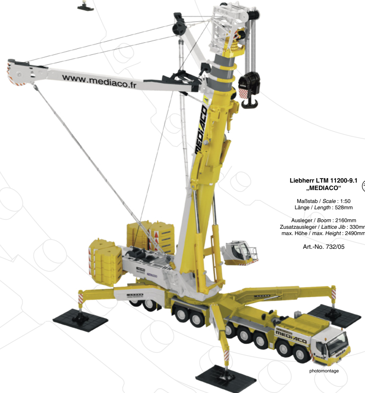
Liebherr LTM 11200-9.1 „MEDIACO“