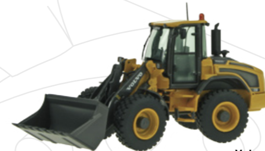
Volvo L50 F

Maßstab / Scale : 1:50 Länge / Length : 190mm Art.-No. 685/03