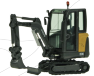
Volvo EC20 C

Maßstab / Scale : 1:50 Länge / Length : 240mm Art.-No. 811