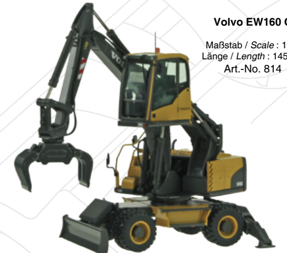
Volvo EW160 C

Maßstab / Scale : 1:50 Länge / Length : 70mm Art.-No. 815