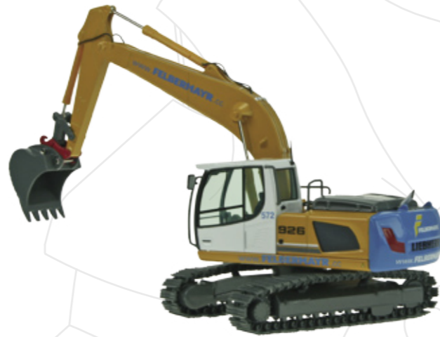
Liebherr R 926 Advanced „FELBERMAYR“