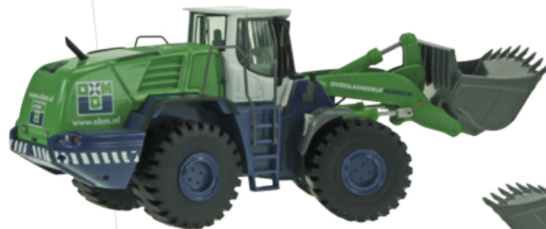
„OBM“ Art.-No. 689/06

Maßstab / Scale : 1:50 Länge / Length : 130mm Art.-No. 816