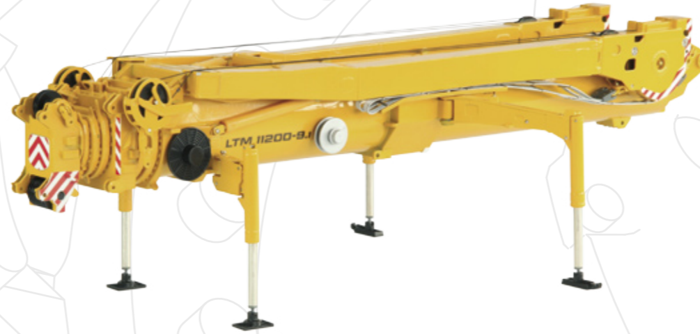
Liebherr LTM 11200-9.1 Auslegerpaket T7 / Boomset T7

Maßstab / Scale : 1:50 Länge / Length : 45mm Art.-No. 829