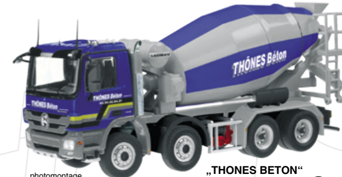
„THONES BETON“ Art.-No. 754/13

Maßstab / Scale : 1:50 Länge / Length : 175mm