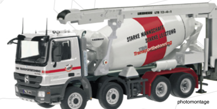
„TBR“ Art.-No. 797/02