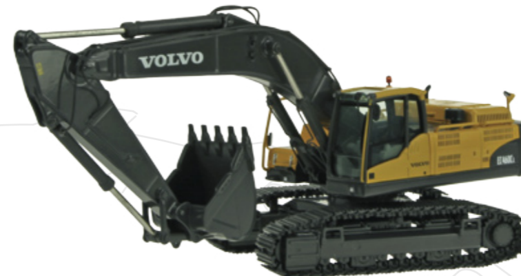
Volvo EC460 CL

Maßstab / Scale : 1:50 Länge / Length : 240mm Art.-No. 811