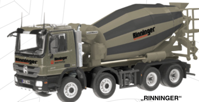
„RINNINGER“ Art.-No. 754/11