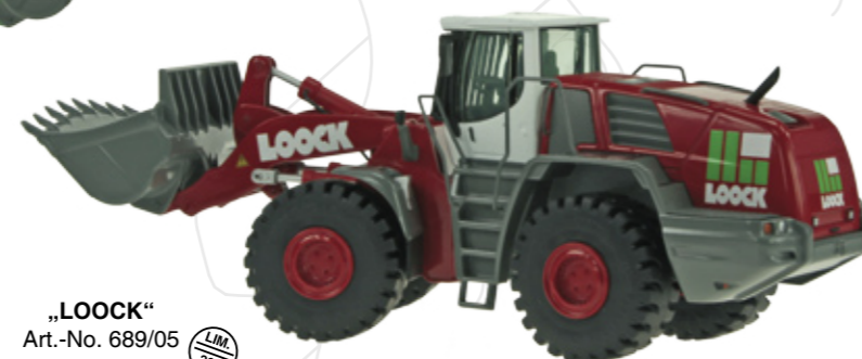
„LOCK“ Art.-No. 689/05

Maßstab / Scale : 1:50 Länge / Length : 200mm