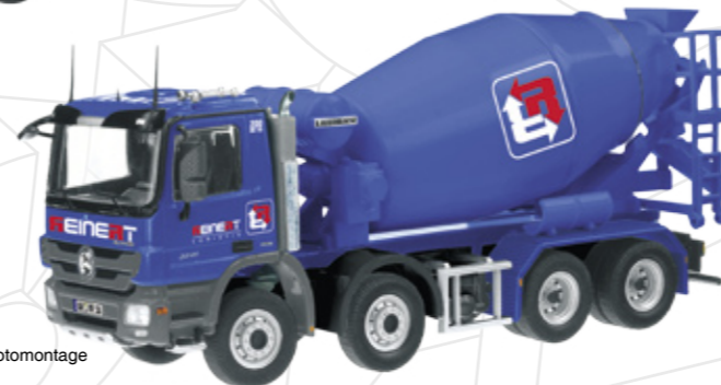
„REINERT“ Art.-No. 754/12