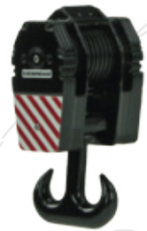
Hakenflasche / Hook Block 320t

Maßstab / Scale : 1:50 Länge / Length : 52mm Art.-No. 828