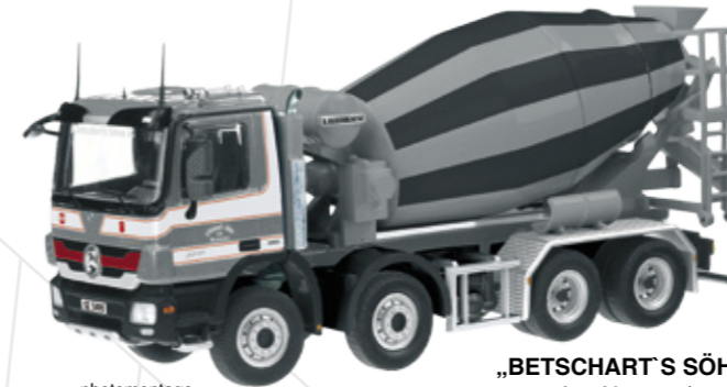
„BETSCHART'S SÖHNE“ Art.-No. 754/16