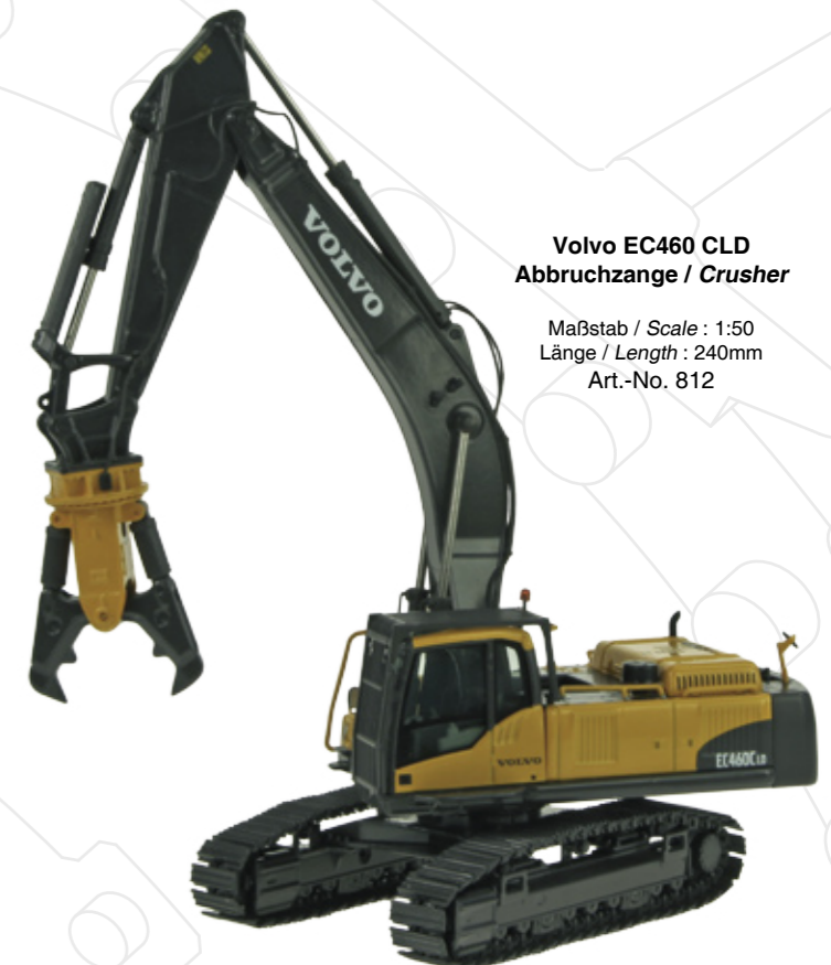
Volvo EC460 CLD Abbruchzange / Crusher

Maßstab / Scale : 1:50 Länge / Length : 145mm Art.-No. 814