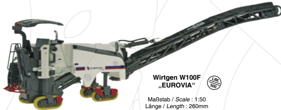
Wirtgen W100F „EUROVIA“

Maßstab / Scale : 1:50 Länge / Length : 260mm Art.-No. 763/04